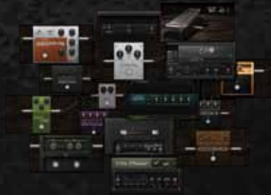
洗練されたストンプ・ボックス

Eleven Rackは、非常に高い評価を獲得するElevenプラグインと同じテクノロジーをベースとしています。以下は、Elevenのトーンに対するユーザーの声です：