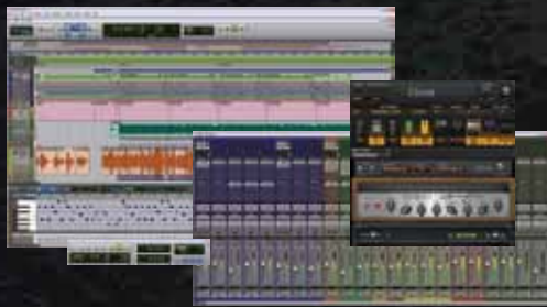
スタジオ標準のPro Toolsレコーディング/編集/ミキシング・ソフトウェア