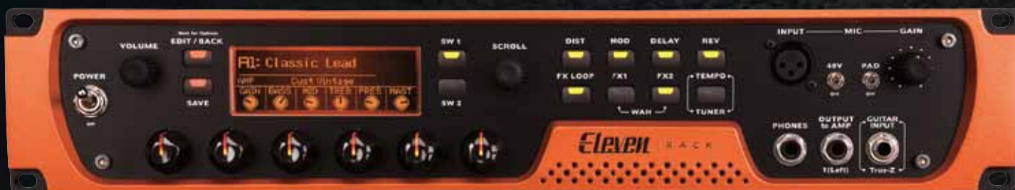
DSPパワーを搭載したオーディオ・インターフェース + スタンドアロン・エフェクト・プロセッサ

Eleven™ Rackは、ギタリストがスタジオやステージで直面する問題を解決するようデザインされた、革新的な新しいギター・レコーディング & エフェクト・プロセッシング・システムです。もう色褪せた、単なるギター・アンプの「モデル」は卒業しましょう。Eleven Rackは、“トーン・クローン”による独自のデザインと、カスタム・デザインされたTrue-Z入力により、完全なギター・セットアップで演奏するのと同じ体験を再現できます。スタジオ標準のPro Tools® softwareとDSPアクセラレーター搭載の高解像度インターフェースを組み合わせたEleven Rackは、すべてのギタリストにプロフェッショナルなレコーディング環境を提供。スタジオでトラックングを行う場合も、ステージ上で演奏する場合にも、Eleven Rackは新鮮で斬新かつハイパーリアルなギター・アンプとエフェクト・トーンを提供するため、ギタリストから最高のパフォーマンスを引き出します。