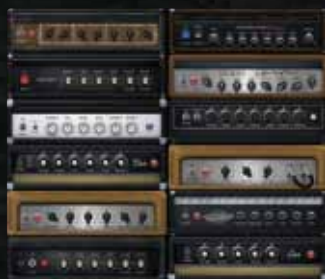
クラス最高のアンプ、キャビネット及びマイク・トーン